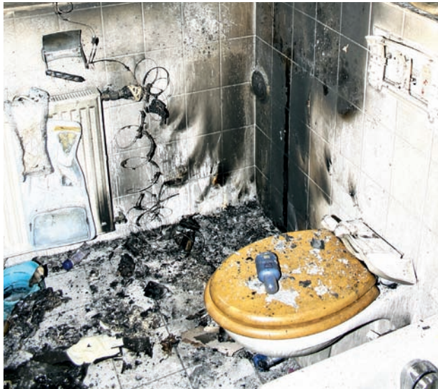
Bild 8 | In dieser Ecke stand ursprünglich ein Wäschetrockner. Trotz eines eigentlich räumlich begrenzten Brandschadens belief sich die Schadensumme auf etwa 15.000 €.

Mitten in der Nacht wurde die Mieterin einer Wohnung durch den Ausfall des Lichtes und auch durch Geräusche auf das Feuer im Badezimmer aufmerksam. Sie versuchte den Brand im Bereich eines dort stehenden Wäschetrockners mittels Brauseschlauch selbst zu löschen. Da ihr dies jedoch nicht mehr gelang, musste sie die Feuerwehr alarmieren. Neben den direkten Brandschäden führten die Rauchgase zu einer merklichen Schadenvergrößerung. Folgeschäden durch Löschwassereinwirkung kamen hinzu. Obwohl das eigentliche Schadenfeuer auf den Standort des Wäschetrockners begrenzt blieb, lag die Schadenhöhe bei 15.000 € – wesentlich beeinflusst durch die Folgeschäden ( Bild 8 ).