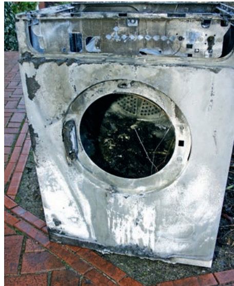
Bild 9 | Blick auf die Frontseite. Obwohl ein erheblicher Zerstörungsgrad vorlag, war zu ermitteln, dass der Brand im oberen Bedienbereich entstand.

Aufgrund dieses Untersuchungsergebnisses konnte der Versicherer einen erfolgreichen Regress einleiten. Die gesamten Schadenkosten übernahm somit der Gerätehersteller.