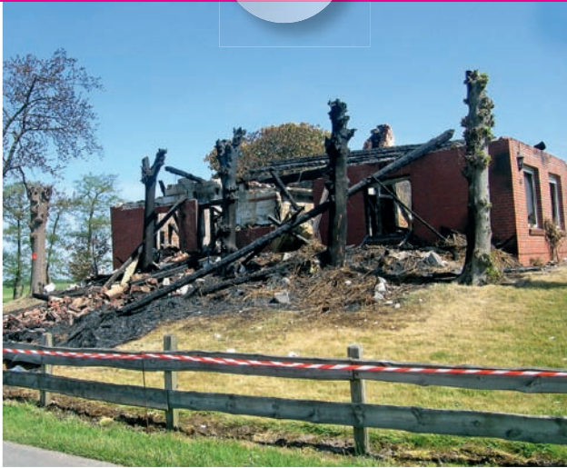
Bild 6 | Eine Kühltruhe hat diesen Schaden verursacht. Die hier vorliegende, vollständige Zerstörung der Gebäudesubstanz ist unschwer zu erkennen.