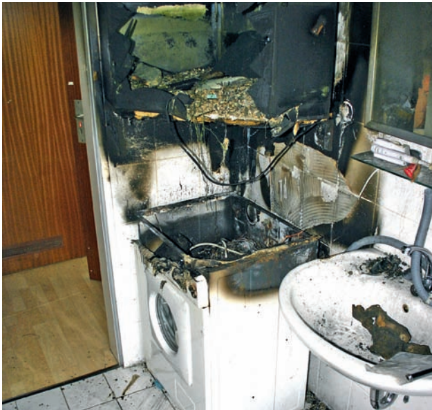
Bild 3 | Brandursache Wäschetrockner. Trotz lokaler Beschränkung des Brandes verursachten die Rauchgase einen Schaden von ca. 15.000 €.

Mitten in der Nacht wurden die Brandbetroffenen aus dem Schlaf gerissen – laute Knackgeräusche und starker Rauch waren die Auslöser. Im Keller fanden sie einen Wäschetrockner brennend vor, der erst vor kurzem eingeschaltet worden war. Eigene Löschversuche schlugen fehl – daraufhin wurde die Feuerwehr alarmiert. Deren rasches Eingreifen führte dazu, dass der Brand auf den Standort des Gerätes eingegrenzt und abgelöscht werden konnte. Den beim Brand entstandenen Rauchgasen gelang es jedoch nahezu ungehindert, alle Räume der Wohnung zu erreichen, was zu einem erheblichen Schaden führte (Bild 3).