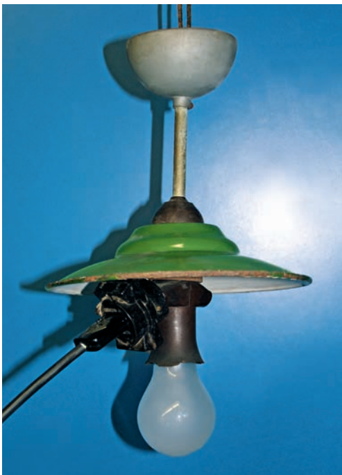
Bild 1 | Ähnlich dieser Leuchte aus dem Fundus des IFS sahen erste Leuchten aus. An eine an der Fassung befindliche Steckverbindung war zum Beispiel ein Bügeleisen anzuschließen. Wandsteckdosen waren anfangs rar.

In den vergangenen Jahren haben elektrische Haushaltsgeräte eine immer stärkere Verbreitung gefunden. Dieser Trend hält weiter an. Damit sind leider auch Gefahren, insbesondere Brandgefahren, verbunden. Der Beitrag führt auf der Basis statistischer Auswertungen im IFS aus, welche Elektrogeräte am häufigsten betroffen sind.