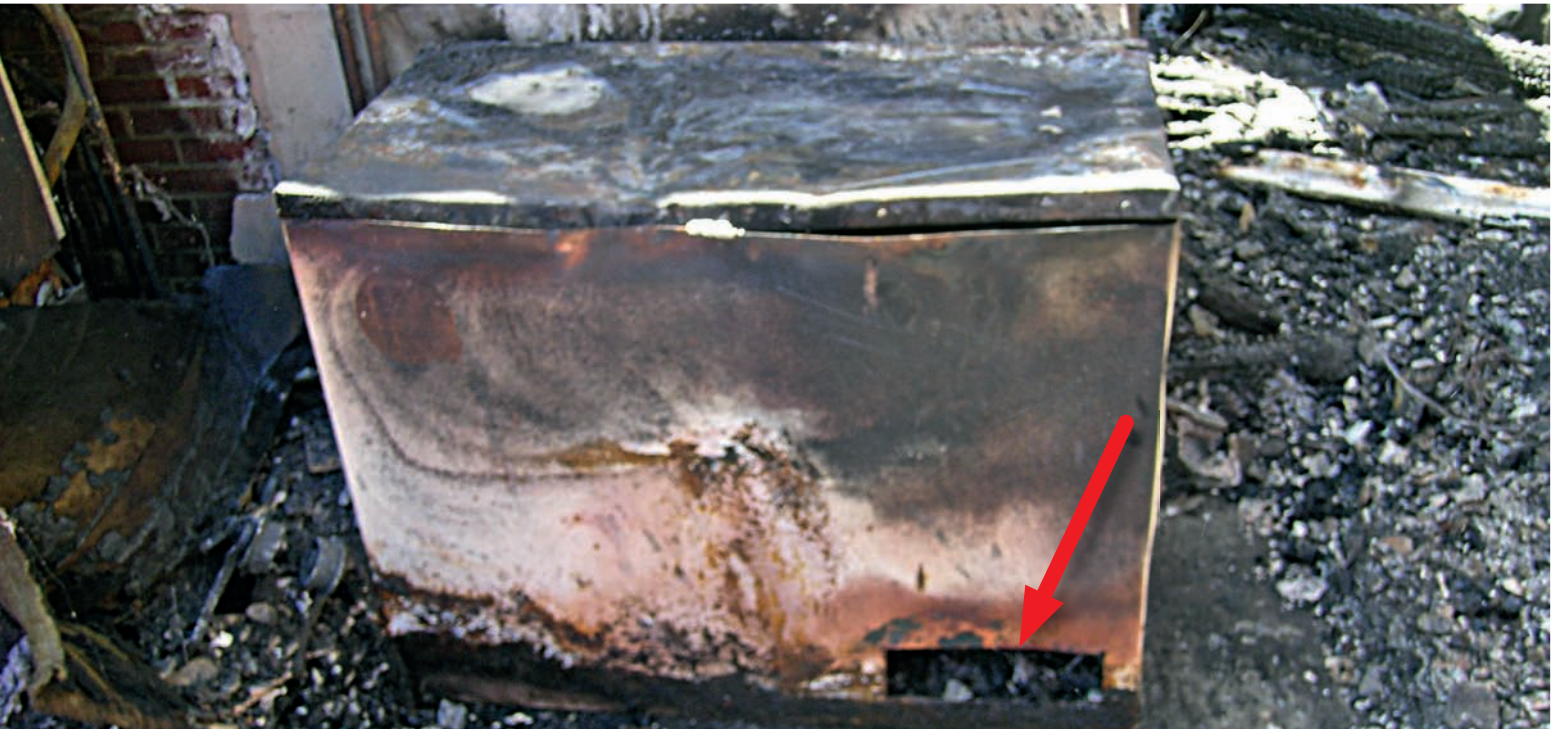
Bild 7 | Durch die Untersuchung vor Ort wurde diese Kühltruhe als Brandverursacher identifiziert. Der Pfeil kennzeichnet den Bereich des Gerätekompressors, wo der Brand seinen Ursprung hatte.