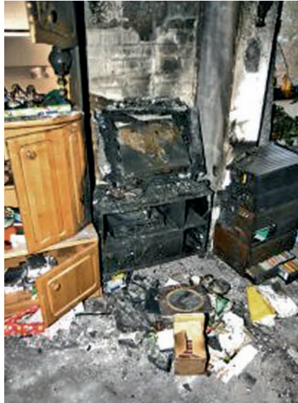
Bild 4 | Brandursache Fernseher: Dieses typische Schadenbild lässt bereits beim ersten Blick den Fernseher als Brandursache vermuten.

Ein älterer Herr wollte schon morgens Sport im Fernsehen schauen. Das Vergnügen dauerte nicht lange. Bereits kurze Zeit nach dem Einschalten des Fernsehgerätes drangen Flammen aus dem hinteren Gerätebereich. Selbst das schnelle Ziehen des Netzkabels kam zu diesem Zeitpunkt längst zu spät. Der Brand breitete sich rasch auf das gesamte Gerät und auch auf das Wohnzimmer aus. Der Mann musste fluchtartig seine Wohnung verlassen. Trotz des insgesamt hohen Zerstörungsgrades am Gerät konnte eine Brandentstehung im Gerät nachgewiesen werden. Die Schadensumme von ca. 63.000 € hatte im Rahmen eines Regressverfahrens der Gerätehersteller zu tragen (Bild 4, 5).