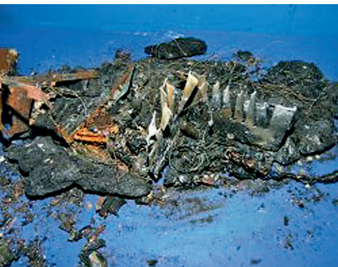
Bild 5 | Auch bei einem höheren Zerstörungsgrad des Fernsehers ist eine erfolgreiche Untersuchung möglich. Von besonderer Bedeutung sind weitere Informationen, wie beispielsweise Hinweise auf mögliche Serienschäden.

Bis vor etwa fünf Jahren waren Brandschäden durch Fernseher in der IFS-Statistik nicht besonders auffällig. Erst in den letzten Jahren ist eine merkliche Zunahme an Brandschäden durch die Geräte zu verzeichnen. Diese Steigerung der Schäden lässt bereits Serienschäden vermuten. Bestätigt haben diese Vermutung gezielte Auswertungen der IFS-Schadendatenbank. Eine Schadenhäufung konnte bei bestimmten Gerätetypen identifiziert werden. Es zeigte sich, dass auf den Hauptplatinen der Geräte „kalte Lötstellen“ vorlagen. Diese fehlerhaften Lötstellen führen bei einem entsprechenden Stromfluss zu einem Schmorschaden auf der Platine, der sich letztendlich zu einem Flammenbrand im Gerät entwickeln kann. Rückrufaktionen namhafter Hersteller sind die Folge. Die Schadenfälle machen jedoch deutlich, dass nicht alle betroffenen Modelle vom Markt genommen werden konnten. In den kommenden Jahren ist also ebenso mit entsprechenden weiteren Bränden zu rechnen. ▶